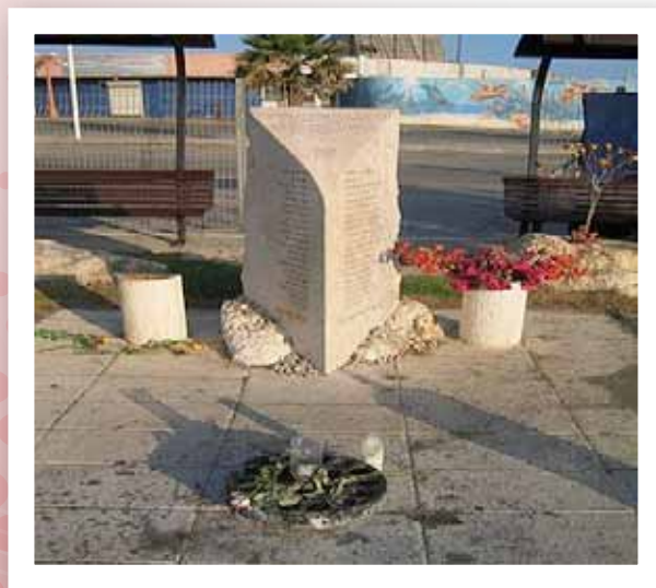
האנדרטה לזכר חללי הפיגוע בדולפינריום

ביוני 2001 התבצע פיגוע על ידי מחבל מתאבד בכניסה למועדון הדולפינריום במהלכו נרצחו 21 אזרחים ונפצעו כ-120 איש בדרגות פציעה שונות.