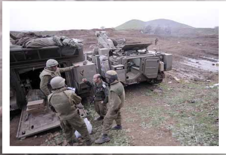
חוליית חימוש פלוגתית

במסגרת ההכנות הרבות אותן ביצע היה חיל החימוש ערוך ומוכן לתרחיש מעין זה. היערכות מקדימה של החיל, איפשרה את הכנת הכלים, את מיגונם והשלמתם של אמצעים נוספים. האתגר שעמד בפני הלוחמים הטכנולוגיים בשלב הראשון של המבצע, התבטא במתן מענה מייד ואיכותי לכל מקרה ותקלה באחד מכלי הרכב ממוגני הירי או באמצעי הצליפה.