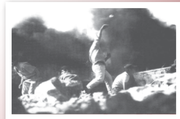
יידו' אבנים על חיילי צה"ל